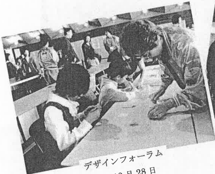
デザインフォーラム 10月28日