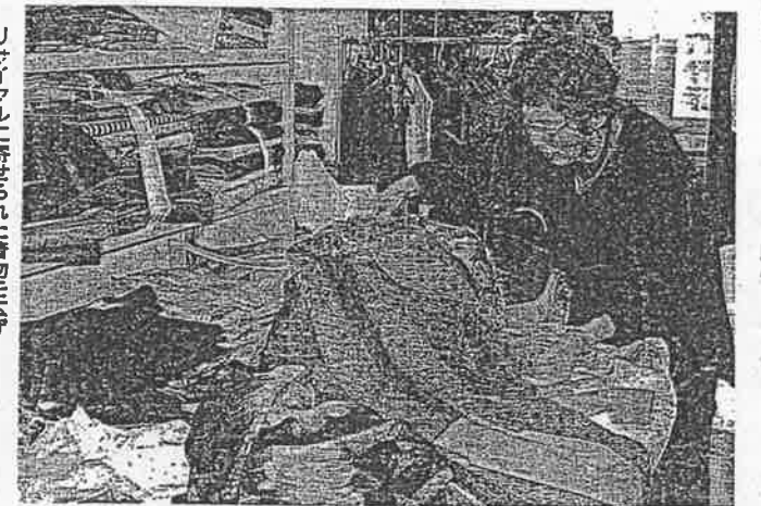
リサイクルに寄付された着物を広げ FRNのメンバーが検査する

北は北海道から南は九州まで、問い合わせが毎日あり、着物の寄付も毎日の様に届きます。