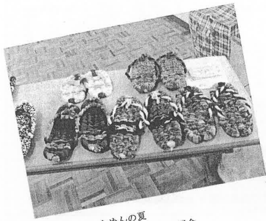
もめんの夏 裂き布ぞうり講習会